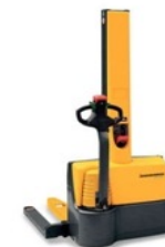
3312 Gyalogkísérő targonca