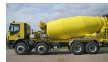
3624 Betonszállító mixer