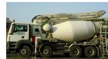
3626 Betonszállító mixer betonszivattyúval