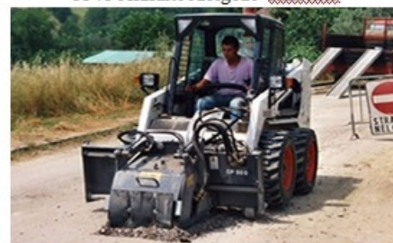
5344 Aszfaltburkolat maró