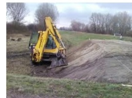
5632 Földműfenntartó gép