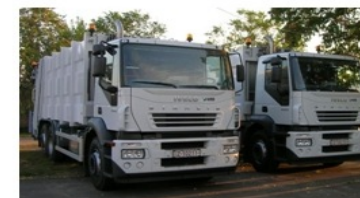
3627 Kényszertömörített szilárd hulladék gyűjtő és szállító