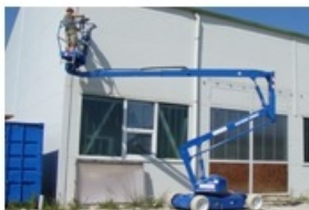
4223 Mobil szerelő kosár