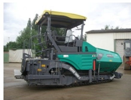
5341 Aszfaltbedolgozó finischer