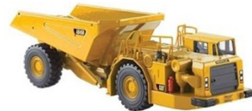
5599 Alagútépítő gép