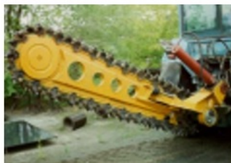
1311 Vedersoros árokásó