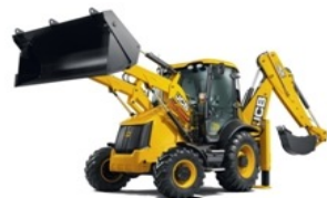
1111 Traktor alapú univerzális földmunkagép