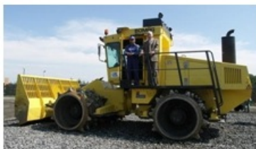
4572 Kompaktor (összecsomogoló)