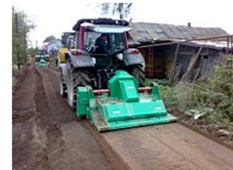
5631 Útfenntartó és karbantartó gép