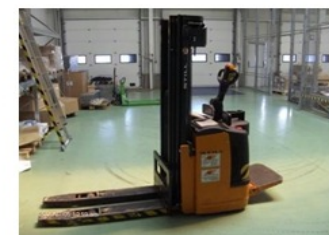
3313 Vezetőállásos targonca