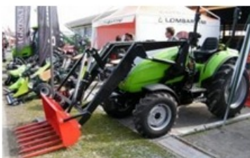
4511 Hidraulikus rakodók