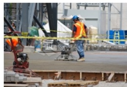
5323 Betonbedolgozó finischer