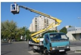
4 hidraulikus szerelőkosaras gépjármű