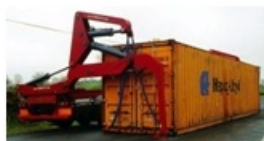
4374 Konténer emelő