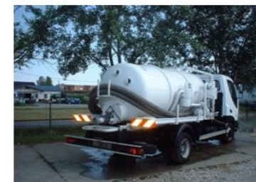
3628 Szennyvízszállító és szippantó jármű