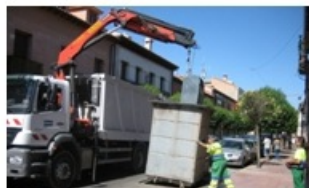
4451 Járműre szerelt daru