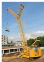
4431 Láncfalpalas daru