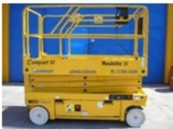
4221 Mobil szerelő állvány