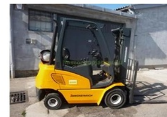
3324 Vezetőüléssel targonca