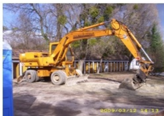
1212 Gumikerekes kotró