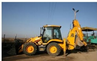
1223 Teleszkópos kotró