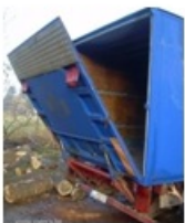
4213 Gépjármű emelő hátfal