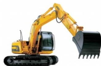
1222 Lánc talpas kotró